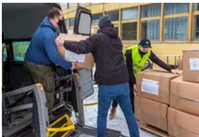
W ramach marszałkowskiego pakietu antykryzysowego do placówek publicznej służby zdrowia w regionie trafiają środki ochrony osobistej -certyfikowane maski, kombinezony i rękawice.

W ramach marszałkowskiego pakietu antykryzysowego do placówek publicznej służby zdrowia w regionie trafiają środki ochrony osobistej -certyfikowane maski, kombinezony i rękawice.