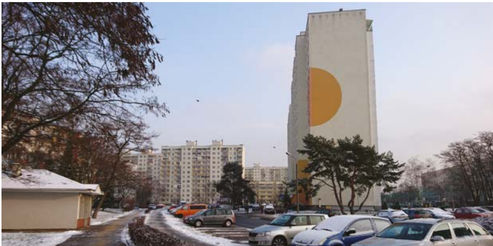
fol. SM na Skarpie

Współczesny świat przeżywa kolejny już głęboki kryzys społeczny i gospodarczy wywołany pandemią groźnej choroby COVID-19, która spowodowała śmierć ponad 370 tysięcy osób na całym świecie. Szczególny rodzaj tej zakaźnej choroby wymusił stosowanie bardzo rygorystycznych zasad postępowania w codziennym życiu i obrony przed jej dalszym rozprzestrzenianiem. Wprowadzenie ścisłej izolacji ludzi wiązało się także z radykalnym wyhamowaniem gospodarki, co oznaczało m.in. masowe zamykanie i unieruchamianie tych przedsiębiorstw i wszelkich innych form życia społecznego, w których istniało największe i bezpośrednie zagrożenie masowych zakażeń.