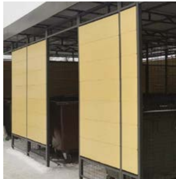
Nowa wiat śmietnikowa przy ul. Śląskiego 6