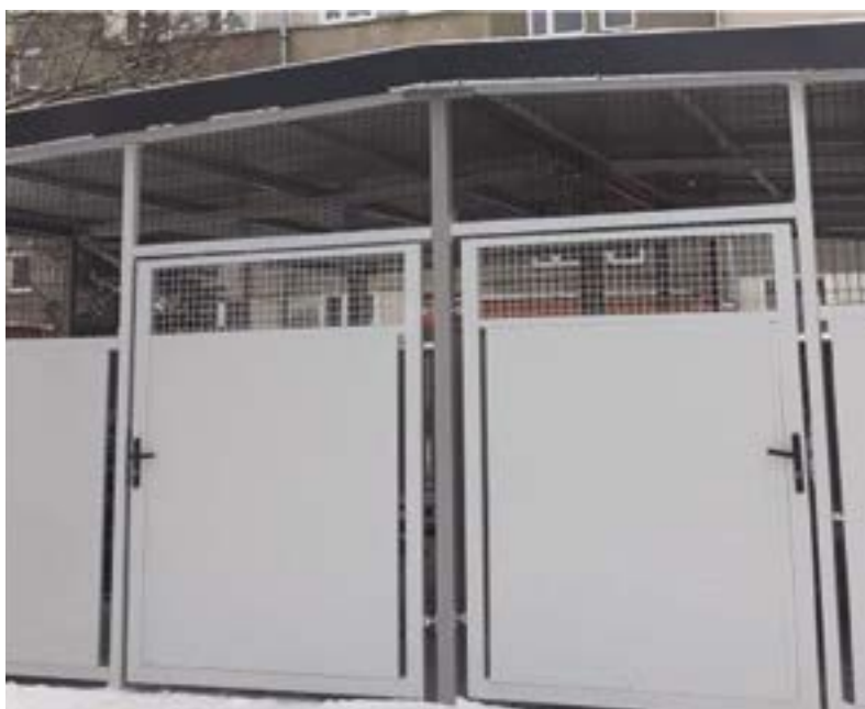
Wiat śmietnikowa przy Szosie Lubickiej 150-152

Otwarcie ofert nastąpi dnia 18.03.2021r. o godz. 11:00 w siedzibie Spółdzielni.