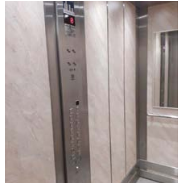
Nowa winda w budynku przy ul. Teligi 5

planie stropodachów i remont pokryć dachowych budynków mieszkalnych, wymianę drzwi wejściowych do budynków