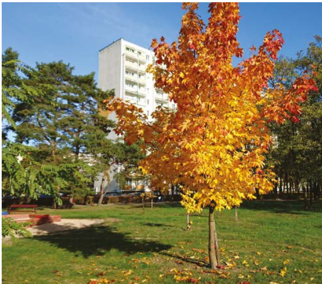
fol. SM Na Skarpie

gospodarce osiągną w du- ną sprzeczności kapitali- zym stopniu kosztem wy- zmu. Niesprawiedliwość kluczenia znacznej części społeczna związana z nie- ludności jako producentów zrównoważonym rozwo- i konsumentów. Tak to ist- jem przestrzeni zamiesz- niejący system społeczno- kiwania wywołuje oddolne -ekonomiczny wytwarza ruchy sprzeciwu. Dzisiaj- narrację, która ma prze- szy „bunt miast” rodzi się rzucić winę z niego na jed- w miejscu zamieszkania nostkę. Do dziś rozważania na tle kwestii przechwy- ekonomistów dotyczące tywania zysku z lokalizacji relacji zatrudnienia, inflacji ziemi i związanych z tym i wzrostu ekonomicznego różnic cen nieruchomości nie wybiegają daleko poza przynoszących dochód. Na zależności oddawane krzy- skalę i nasilenie migracji wą Phillipsa i długookreso- osiedleńczych oddziaływać wą krzywą Phillipsa. Nara- trzeba zatem u lokalnych sta wszakże przekonanie, źródeł odnowionych auto- że główny nurt ekonomii nomicznymi wspólnotami wymaga zmiany znacznie opartymi na pracy. Zbyt- głębszej niż za pomocą de- ni globalny wzrost liczby finansyzacji gospodarki. ludności, który stanowi istotny czynnik dzisiejsze-