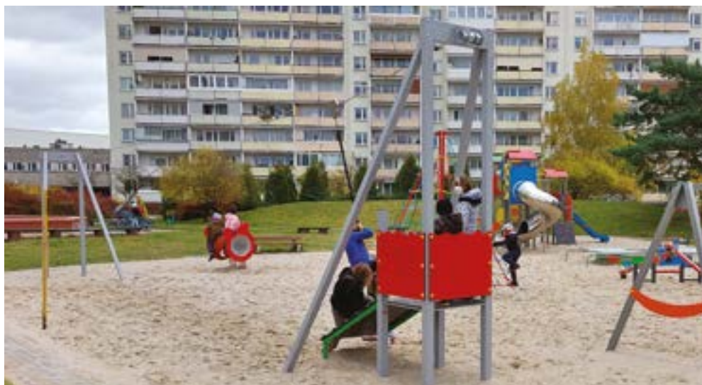
Jednym z najbardziej obleganych urządzeń na nowym placu zabaw jest Tyrolka