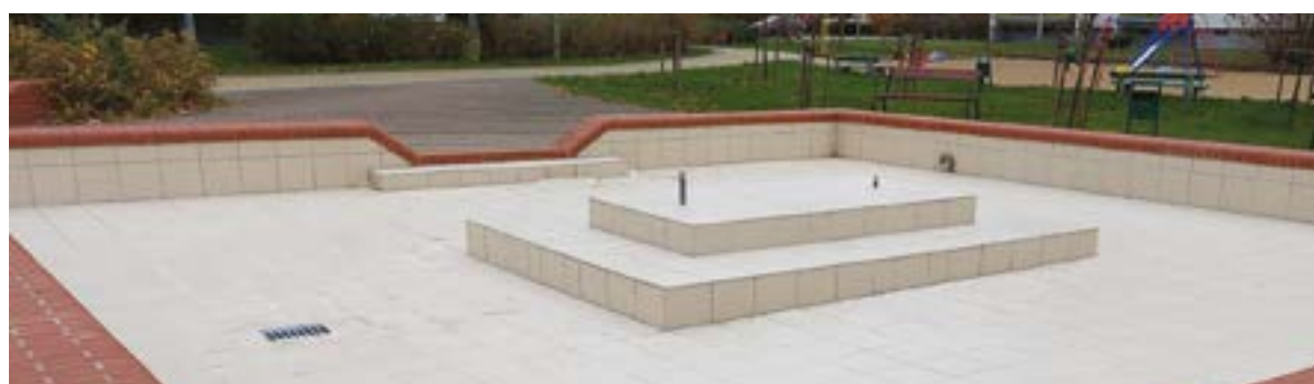
Wyremontowana fontanna przy ulicy Kusocińskiego

Co można zrobić z takimi pozostałościami, zamiast wyrzucać odpady „pod nogi”, powodując niekiedy również zagrożenie dla zdrowia innych mieszkańców (ewentualne poślizgnięcie się na takich pozostałościach może doprowadzić nawet do złamania)? Możemy je wyrzucić do specjalnego pojemnika (z brązową naklejką) lub pojemnika na odpady zmieszane. Możliwe jest także bezpłatne pobranie worków na bioodpady u gospodarzy domów oraz w administracji osiedla przy ul. Wyszyńskiego 6. Pamiętajmy, że gromadzenie bioodpadów w ogródkach jest zakazane! Wycięte rośliny czy gałęzie nie mogą zalegać na wspólnym, zamieszkałym terenie, a wyrzucanie i składowanie tych roślinnych odpadów niszczy trawniki.