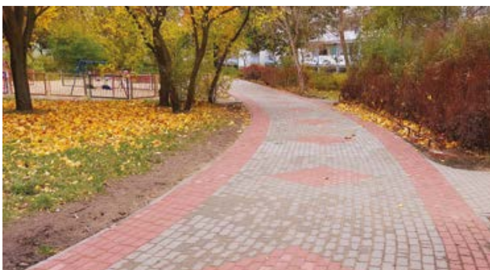
Nowa nawierzchnia chodnika przy ulicy Szosa Lubicka 182