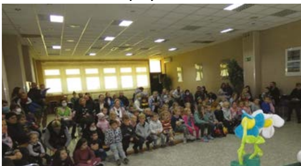
Występy Teatru Vaška w Klubie Zodiak cieszą się sporą popularnością. Na kolejne spektakle zapraszamy 13 i 27 listopada 2021 roku.