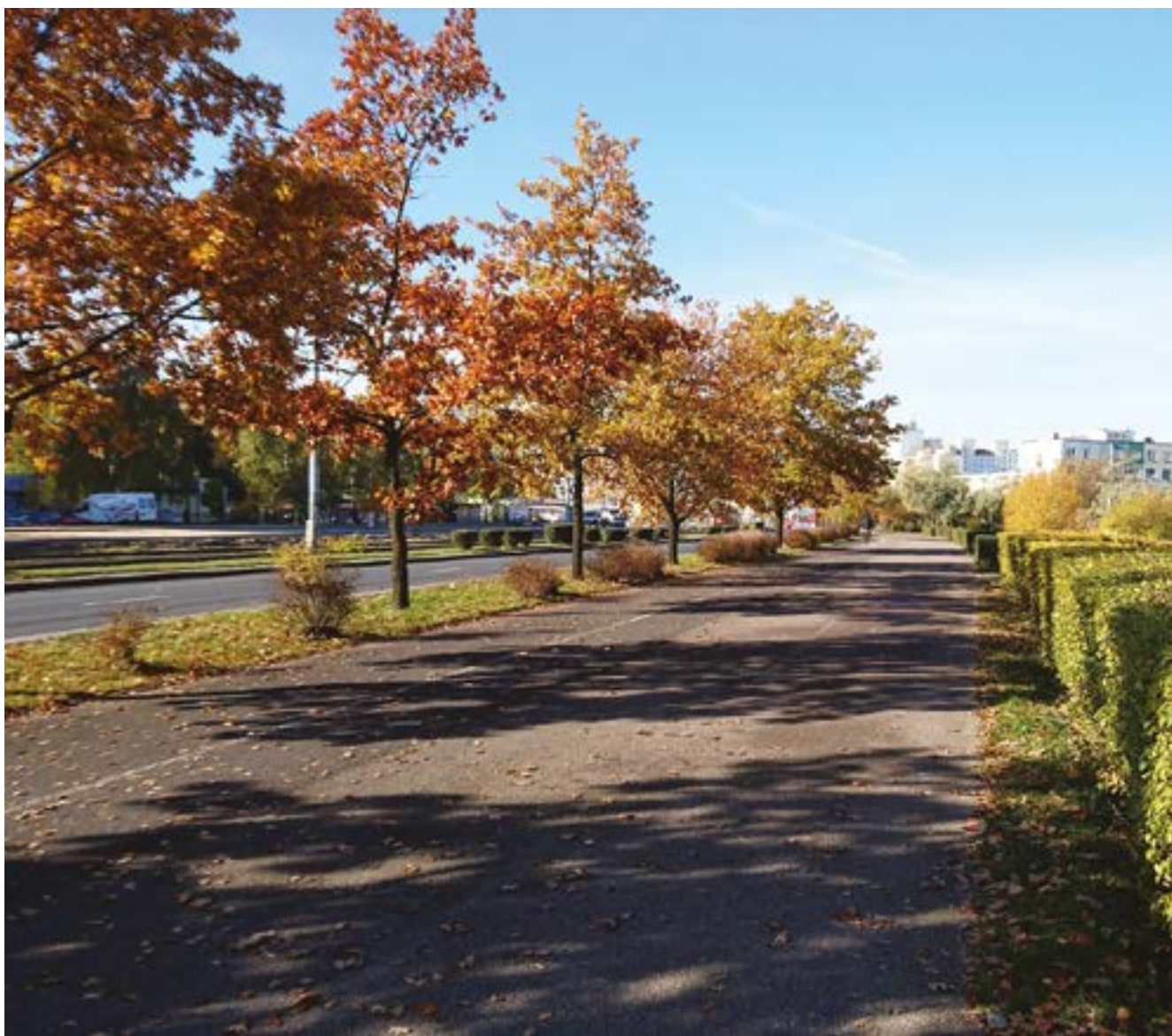
fol. SM Na Skarpie

Związane z tym dalsze niekiedy jako przyczyna spowolnienie wzrostu go- automatyzacji. Zapomina spodarczego spadnie nie się, że owe starzenie się na największe prywatne stanowi opartą na rynko- firmy technologiczne itp., wej rywalizacji odpowiedź lecz, podobnie jak po 2007 na techniczne innowacje r, na sektor publiczny, a w w poszukiwaniu zysków. konsekwencji na warstwy Nadwyżka ekonomiczna społeczne bazujące na tra- jest w dzisiejszej globalnej