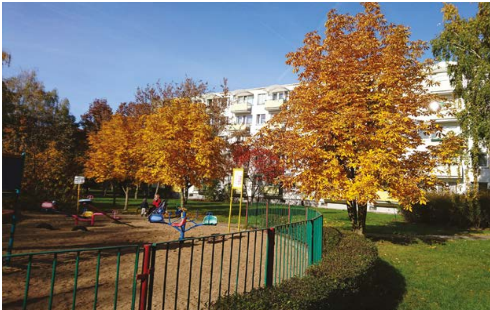
fol. SM Na Skarpie

Tradycyjne przemieszczanie się człowieka będącego wolną istotą szukającą wa-