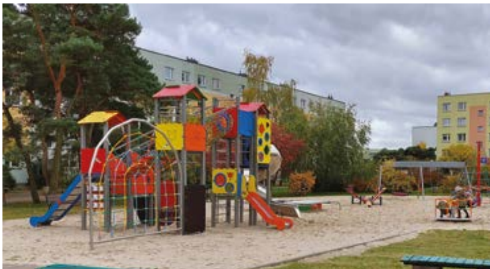
Całkowicie zmodernizowany plac zabaw przy ulicy Srebrnego