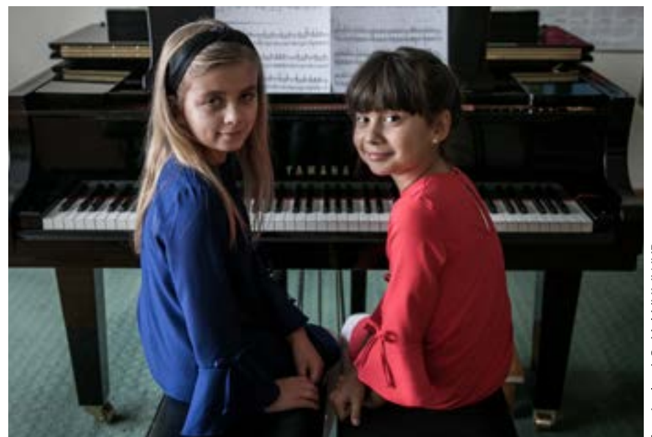
Zespół Szkół Muzycznych w Toruniu świętuje w tym roku stulecie działalności.

Wszystko zaczęło się 1 września 1921 roku, kiedy za sprawą Konfraterni Artystów i Pomorskiego Towarzystwa Muzycznego zostało powołane do życia Konserwatorium Muzyczne. Przez wszystkie lata międzywojenne szkoła, wspólnie z Pomorskim Towarzystwem Muzycznym, kształtowała życie artystyczne Torunia. Po II wojnie światowej szybko wznowiła działalność – początkowo jako Instytut Muzyki, by ostatecznie przekształcić się w zespół łączący szkoły muzyczne pierwszego i drugiego stopnia. W stuletniej historii placówki przez jej mury przewinęło się wiele znakomitych postaci, w tym wirtuozi koncertujący z powodzeniem w czołowych salach koncertowych w kraju i za granicą, kompozytorzy, dyrygenci i muzykolodzy. Absolwenci podkreślają wyjątkową atmosferę, która towarzyszyła im przez wszystkie lata nauki.