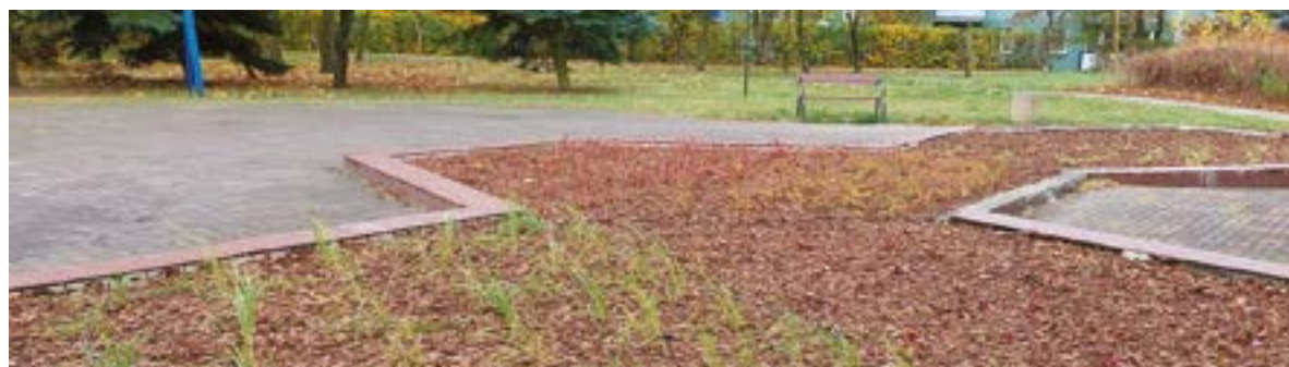
Fontanna zamieniona na kwiatnik przy ulicy Prejsa