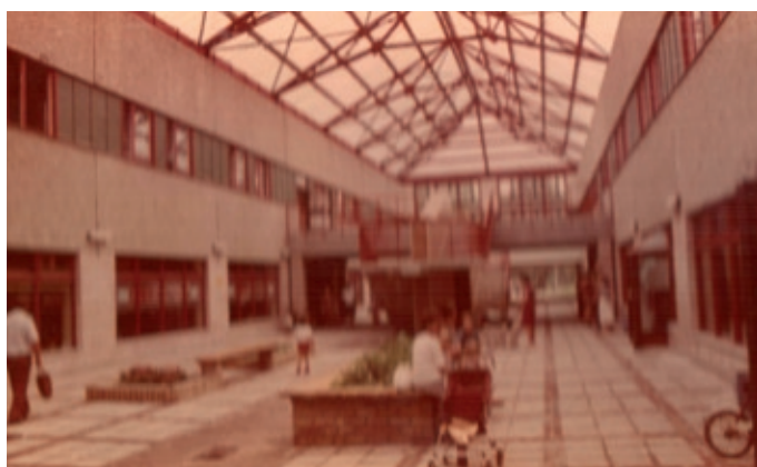
Tak kiedyś wyglądał Pawilon Maciej