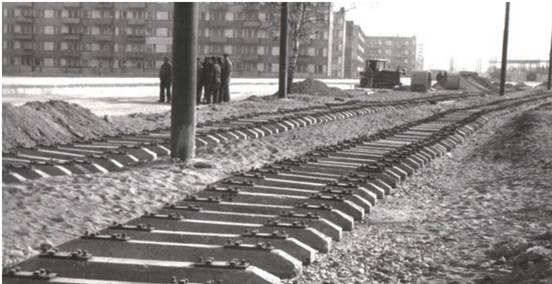
Pierwsze fragmenty linii tramwajowej biegnącej Konstytucji 3 Maja w głąb osiedla