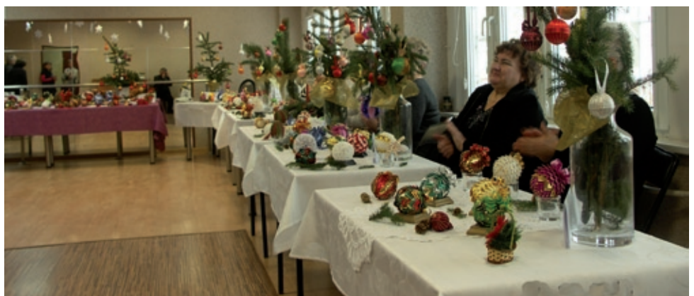
Wystawy, to dla senierek okazja do pochwalenia się samodzielnie wykonanymi pracami