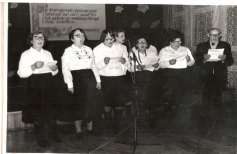
Chór „Skarpianki” z Klubu Seniora