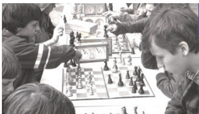
Osiedlowy turniej szachowy