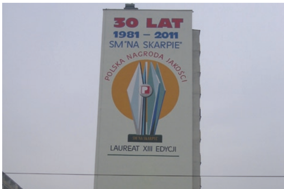
Szczyt budynku przy ul. Śląskiego 1.

Więcej o 30. latach Spółdzielni wewnątrz numeru