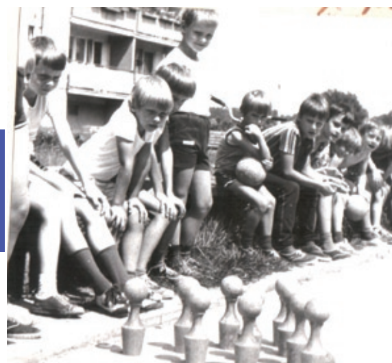
Rozrywka w czasie wakacji - osiedlowe kręgle