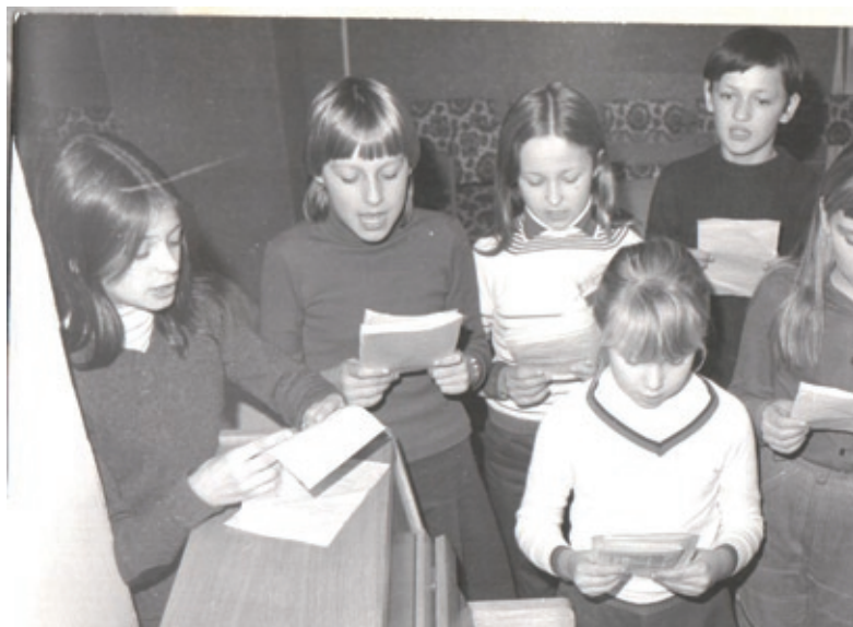
Od początku istnienia Na Skarpie funkcjonowały osiedlowe kluby i tak jest do dziś