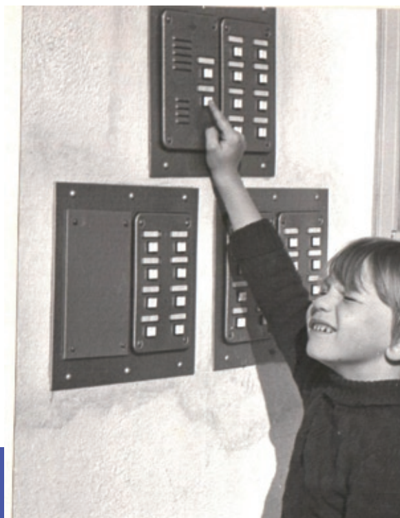
Pierwsze domofony na osiedlu