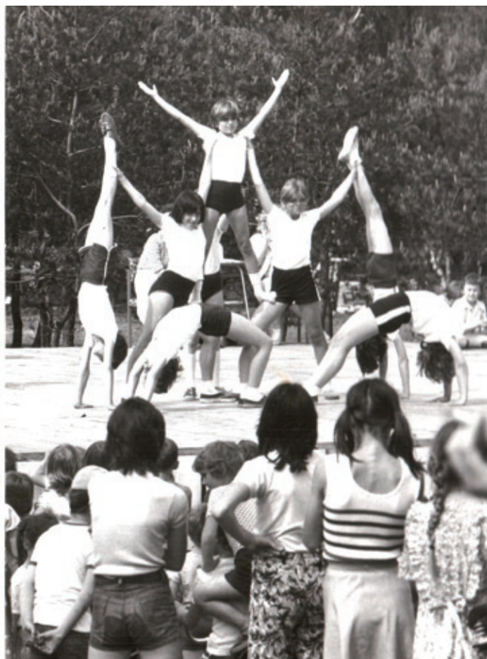
Dzień Dziecka - pokaz grupy akrobatycznej z SP 28