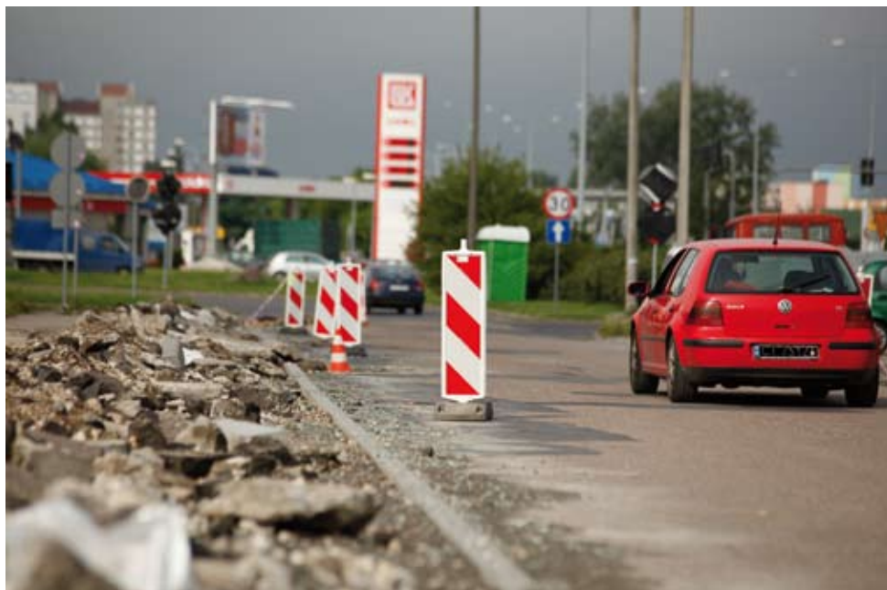
Kolankowskiego była ulicą bardzo zniszczoną przez jeżdżące tędy autobusy

Druga inwestycja Miejskiego Zarządu Dróg,