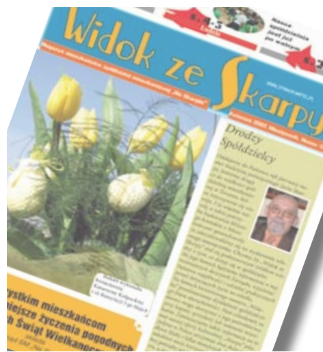
Tak wyglądał pierwszy numer Widoku ze Skarpie

Oddajemy w ręce Spółdzielców 50-ty, jubileuszowy numer naszej gazety. Od początku celem jej wydawania było bycie bliżej mieszkańców, wypowiadanie się na tematy ważne dla naszej Spółdzielni w sposób jasny i przejrzysty. Niejednokrotnie członkowie naszej społeczności brali aktywny udział w tworzeniu pisma, udzielając głosu w sondach, czy też przesyłając pytania, na które odpowiedzi udzielali pracownicy Spółdzielni. Aby grono tych, którzy na co dzień tworzą administrację SM Na Skarpie było czytelnikom bardziej znane, przedstawialiśmy poszczególne sylwetki pracowników, wyjaśniając, jaka jest ich rola w zarządzaniu ważnymi sprawami