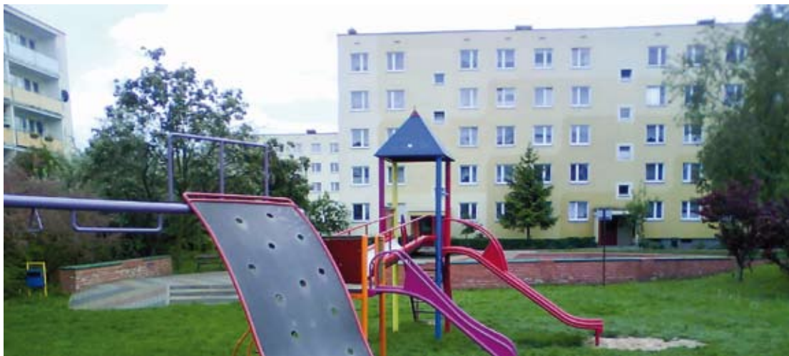
Nowe, kolorowe elementy zabawowe spełniają normy unijne, są bezpieczne i estetyczne

Z nastaniem wiosny place zabaw na osiedlu czeka prawdziwe obłędzenie. Trwają intensywne prace, których celem jest poprawa ich estetyki i bezpieczeństwa.