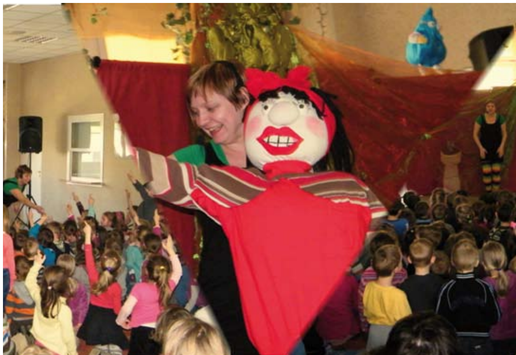
Dział społeczny i oświatowo-kulturalny SM „Na Skarpie” zaprosił dzieci w wieku 3 – 6 lat na spektakl pt. „Łza Ziemi”. Efektowna scenografia, barwne lalki i melodyjne piosenki zapewniły maluchom dobrą zabawę