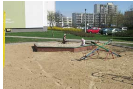
Prace na placach zabaw trwają – wymieniony został piasek, a wokół placów pojawiły się kolorowe opaski z cegły klinkierowej

kich piaskownicach, w zeszłym roku zużyto 286 ton, w tym roku była to podobna ilość. Służby porządkowe codziennie dokonują przeglądu terenów zabawowych – Gospodarz sprawdza, czy żadne urządzenia nie zostały uszkodzone, jeśli tak się stało, zgłasza to wykonawcy. Wymiany dokonujemy pamiętając o estetyce, jeśli wandalę urwą czerwone siedzisko, to na miejsce wraca element w tym samym kolorze. Poza tym dbamy o czystość. Niestety dorośli nie szanując potrzeb maluchów urządzają sobie imprezy na terenie pla-