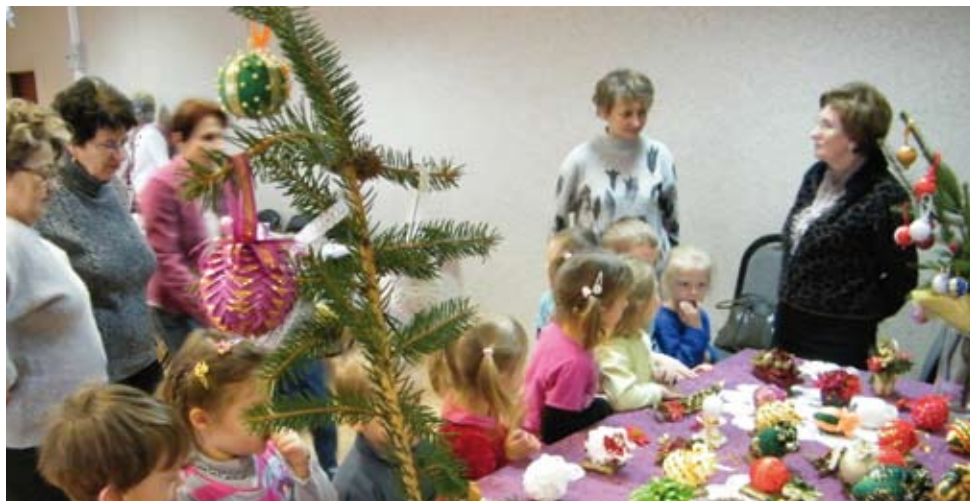
Zaprezentowane na wystawie w Klubie Vademecum prace rękodzielnicze były chętnie podziwiane przez rodziny ich autorek i mieszkańców

moje prace, bardzo im się podobały. Zajęcia z rękodziela to świetny relaks, można się odprężyć, spotkać z koleżankami. Nawzajem pokazujemy sobie wzory, cierpliwie tłumaczymy. Dla mnie to też forma rehabilitacji, która była mi potrzebna po zabiegu operacyjnym, teraz dłonie mam dużo sprawniejsze.