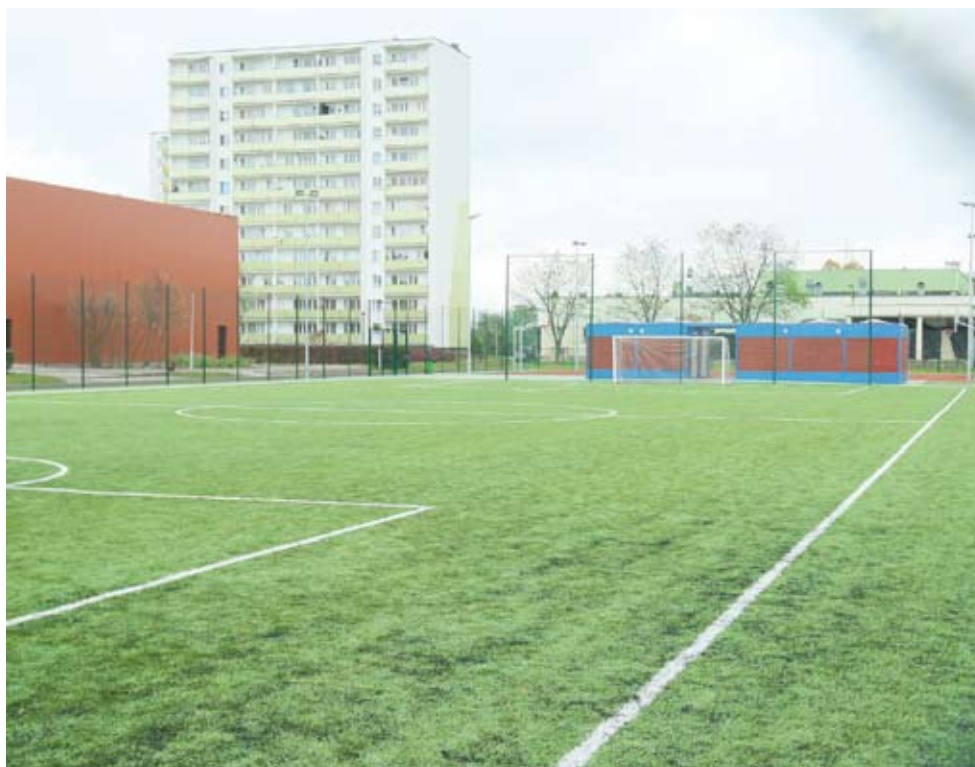
Orlik to nowe boisko, które powstało przy ul. Kosynierów Kościuszkowskich

Warto dodać, że Orlik sąsiaduje z dużą salą gimnastyczną, siłownią i basenem pobliskiej szkoły.