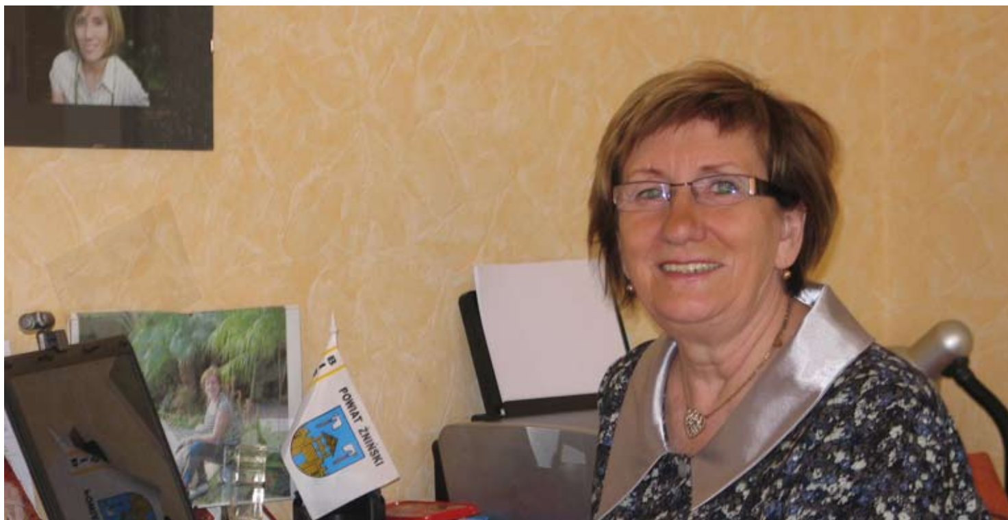
Klub Seniora działa w Klubie Vademecum przy Ligi Polskiej 5. Spotkania towarzyskie odbywają się w każdy czwartek o godzinie 16.30. Osoby starsze chętne do uczestniczenia w spacerach Nordic Walking, sekcji rękodzielniczej, lub mające pomysł na innego rodzaju aktywność prosimy o zgłaszanie się do Klubu Vademecum.

Lubi przebywać z ludźmi. Od 14 lat jest na emeryturze, ale nie wyobraża sobie życia bez pracy. Dzięki niej Klub Seniora działający przy Klubie Vademecum będzie miał szanse rozwinąć się o nowe aktywności.