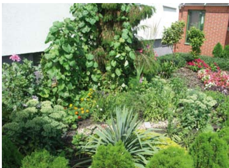
Dwa różne ogródki przy Wyszyńskiego 17