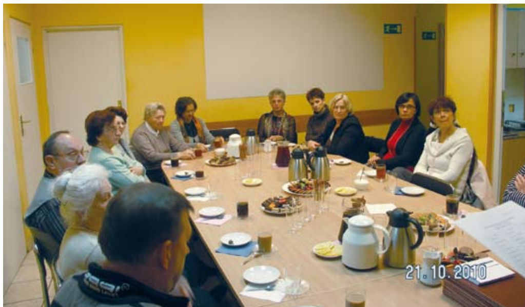
Spotkanie z laureatami konkursu