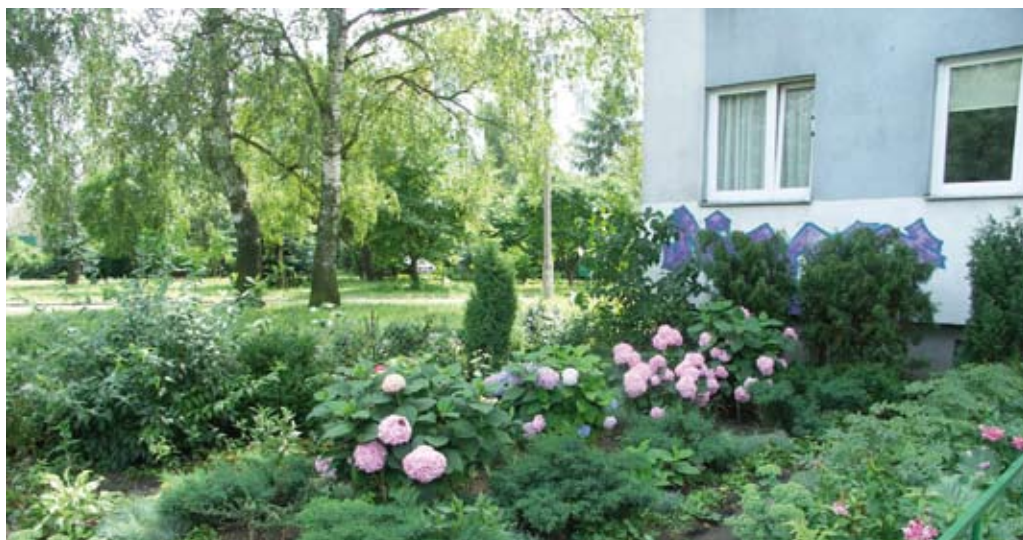
Przy Skarpie 21