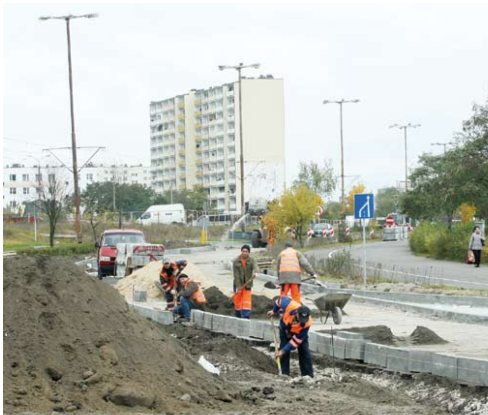
Remont potrwa do 10. grudnia

Remont nie oznacza, że ulica jest wyłączona z ruchu. Ekipy pracują bowiem rotacyjnie, remontują jeden pas, a drugim ruch odbywa się normalnie. Dzisiaj Konstytucji 3-go Maja jest nieprzejezdna w kierunku Centrum: od Ligi Polskiej, aż do Śląskiego. Objazd będzie oczywiście Szosą Lubicką.