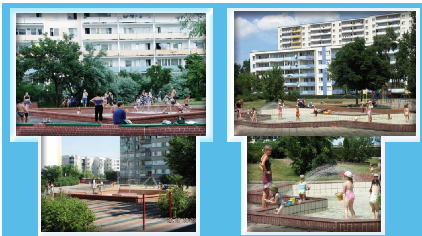
Letnie upały są bardziej znośne dzięki ośmiu fontanom na naszym osiedlu. W czasie wakacji dzieci chętnie się w nich bawią, a dorośli mogą w chłodzie odpocząć na pobliskich ławkach.