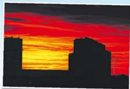
Tytuł: Zachód Nazwa obiektu: wieżowce na Konstytucji 3-go Maja, koło pawilonu Maciej Miejsce zrobienia zdjęcia: widok z okna mieszkania na Wyszyńskiego