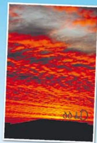
Tytuł: Wschód Nazwa obiektu: dach pawilonu spółdzielni na Wyszyńskiego Miejsce zrobienia zdjęcia: widok z okna mieszkania na Wyszyńskiego