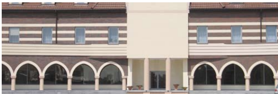
Zespół sakralny będzie o wiele większy niż dzisiaj

Parafia oo. paulinów pw. Najświętszej Maryi Panny Częstochowskiej w Toruniu została ustanowiona dekretem z 26 sierpnia 1996 r. Wkrótce później na przekazanym przez miasto gruncie, ograniczonym ulicami: Konstytucji 3 Maja i Przy Skarpie stanęła tymczasowa kaplica, w której w styczniu 1999 r. odprawiono pierwsze nabożeństwo. Tego samego roku,