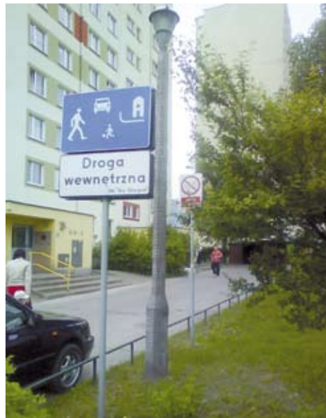
Obok bloku przy Szosie Lubickiej 162 znajduje się znak „strefa zamieszkania” i „droga wewnętrzna” - oba narzucają kierowcom konieczność zwolnienia do 20 km/h oraz parkowania wyłącznie w miejscach oznaczonych

Przypominamy także, że w strefie zamieszkania parkować można tylko w miejscach do tego przeznaczonych, oznaczonych znakiem parking.