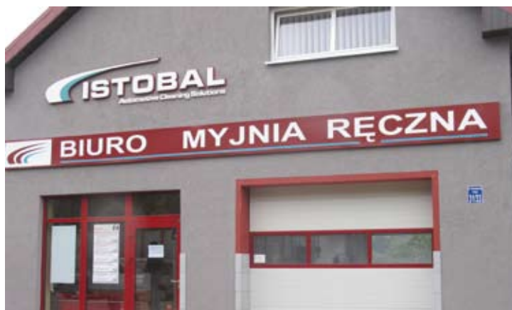
Myjnia Istobal przy Konstytucji 3 Maja 31/33

W programach od 2-5 płacimy złotówkę za każde 45 sekund. Drugi program, to mycie zasadnicze nowym szamponem w proszku, rozpuszczonym w gorącej wodzie o temperaturze około 60 stopni i podawanym pod ciśnieniem maksymalnie dozwol-