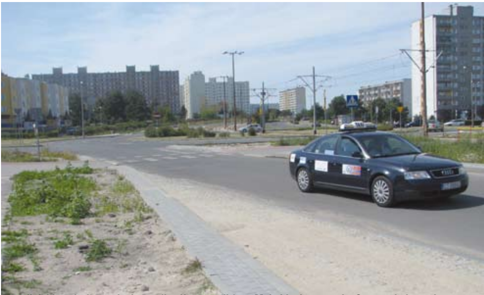
Powoli dobiega końca rozbudowa ulicy Konstytucji 3-go Maja i budowa ronda. O nowych drogach na naszym osiedlu piszemy na stronie 4.