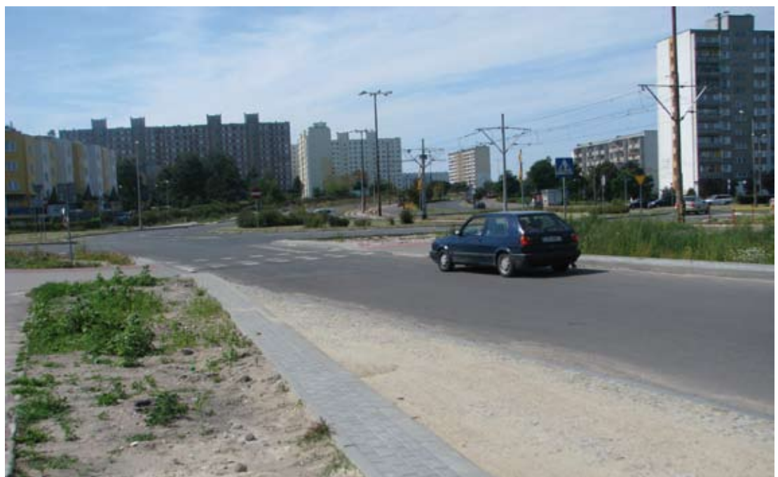
Rondo Honorowych Dawców Krwi po modernizacji stanie się rondem z prawdziwego zdarzenia. Dzisiaj jest tu niebezpiecznie.

Drogowcy kończą też remont nawierzchni ulicy Wyszyńskiego. Nowy asfalt jest wylewany pomiędzy Konstytucji 3-go Maja, a pawilonem Karolina.