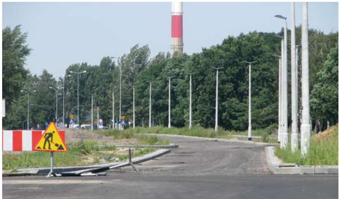
Nowy odcinek ulicy Olimpijskiej będzie się zaczynał na rondzie na pętli „jedynki” i pobiegnie prosto do Szosy Lubickiej

Dwa pasy Konstytucji 3-go Maja, przebudowa rondo Honorowych Dawców Krwi i nowa nawierzchnia ulicy Wyszyńskiego - to najnowsze drogowe inwestycje na naszym osiedlu.