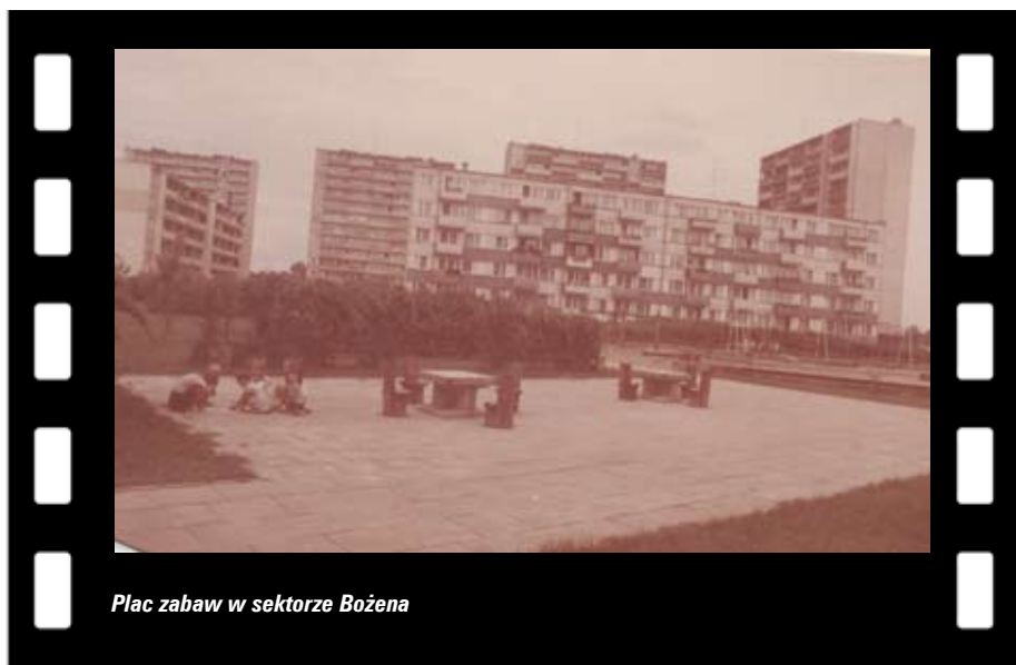
Plac zabaw w sektorze Bożena