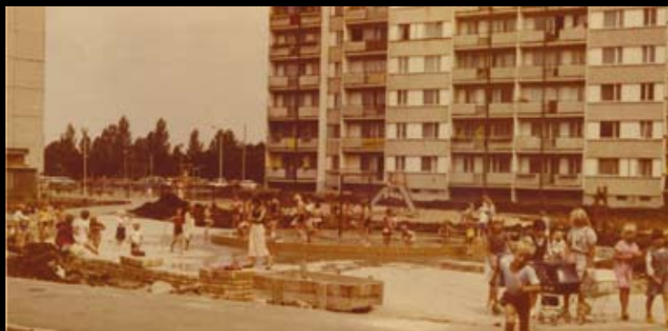
Plac zabaw z brodzikiem w sektorze Anna