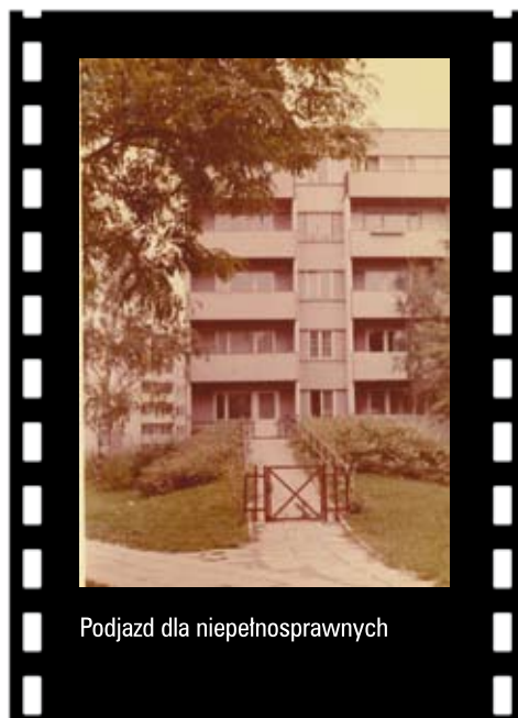
Podjazd dla niepełnosprawnych