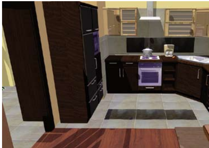
Dzięki dobremu projektowi nawet mała kuchnia w bloku może stać się funkcjonalna, wygodna i estetyczna.

Pierwszym krokiem może być usunięcie ściany między pokojem, a kuchnią (o ile uzyskamy na to zgodę Spółdzielni), dzięki temu powiększymy salon o aneks kuchenny. Zyskujemy sporą, otwartą przestrzeń. Wówczas zastępując instalację gazową, instalacją elektryczną możemy sobie pozwolić nawet na zaprojektowanie tzw. wyspy, czyli kuchenki, która stoi na środku, lub półwyspy, czyli ciągu szafek, wychodzących blatem w kierunku pokoju, zakończonym płytą grzewczą. Ściankę dzielącą można postawić też częściowo, nie od sufitu do podłogi, ale tylko na zasadzie symbolicznego odcięcia części kuchennej od jadalnej.