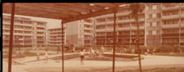
Plac zabaw z brodzikiem w sektorze Regina

„Widok ze Skarpy” - bezpłatny magazyn mieszkańców Spółdzielni Mieszkaniowej „Na Skarpie” Wydawca: SM Na Skarpie, Wojciech Piechota: tel. 56 648 66 22, fax 56 648 61 00, email: widok@smnaskarpie.pl , redaktor naczelny: Dorota Gładkowska, reklama, tel.(0) 668 339 790, druk: Drukarnia, ul. Ołowiana 10, 85-461 Bydgoszcz, Redakcja nie zwraca tekstów nie zamówionych, zastrzega sobie prawo do redagowania i skracania nadesłanych materiałów. Za treść reklam i ogłoszeń wydawca nie odpowiada.