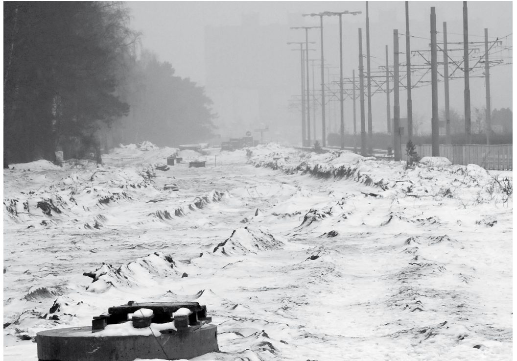
Konstytucji 3-go Maja będzie miała po dwa pasy w każdą stronę