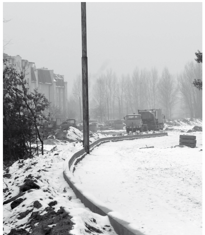
Tędy pobiegnie nowy odcinek Olimpijskiej

czasowy zawijas. Olimpijska pobiegnie bliżej lasu i połączy się z Konstytucji 3-go Maja rondem, które dzisiaj wykorzystywane jest tylko przez zwracające tutaj autobusy.