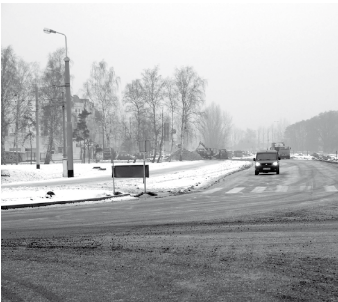
Z Szosy Lubickiej będzie się jechało prostą ulicą Olimpijską wprost do ronda łączącego ją z Konstytucji 3-go Maja