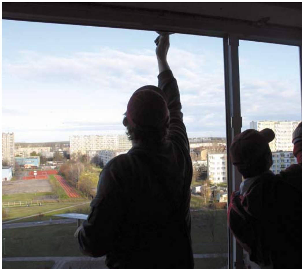
K&K to wysokiej jakości okna i profesjonalny montaż

Ul. Wyszyńskiego 6 (od drugiej potowy lutego)