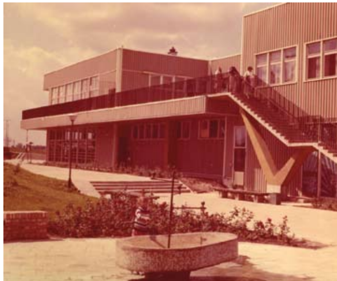
Budynek SM „Na Skarpie od strony Konsytucji 3-go Maja