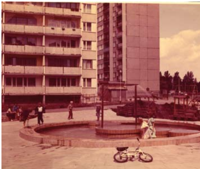
Skwer w sektorze Anna z fontanną