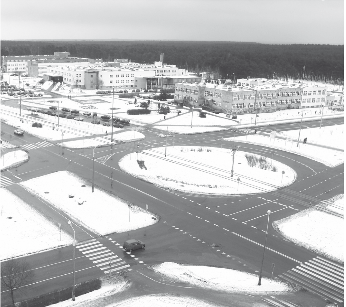
Plac Honorowych Dawców Krwi - jak widać na archiwalnym zdjęciu z lotu ptaka - nie jest dzisiaj prawdziwym rondem

Prawie 10 milionów złotych będzie kosztowała przebudowa ulicy Konstytucji 3-go Maja, która właśnie się zaczęła.