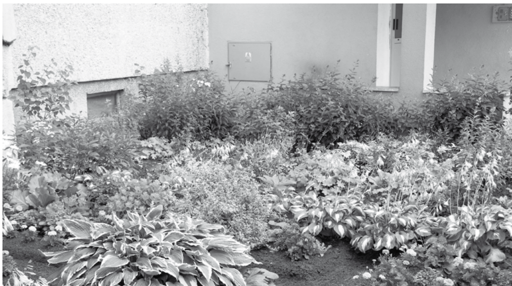
Tak wygląda przydomowy ogródek przy ul. Stamma 2F