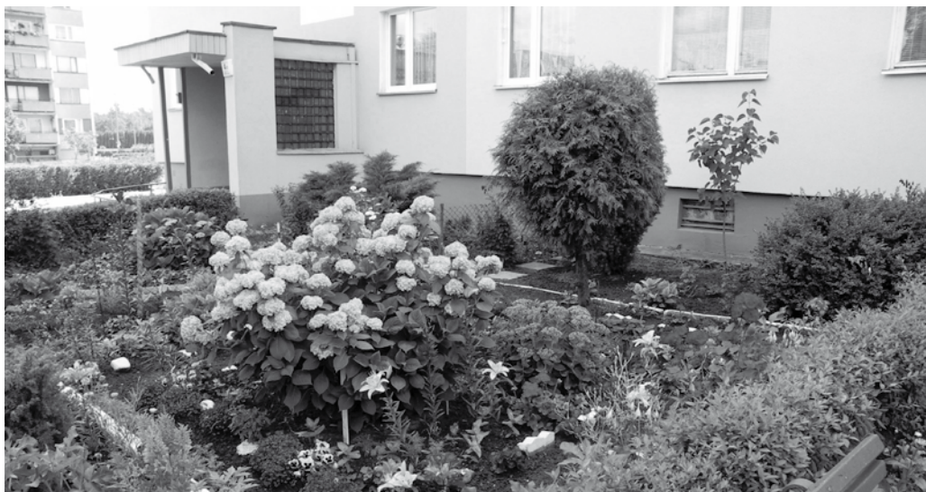
A to już oczko przy ul. Szarych Szeregów 4f