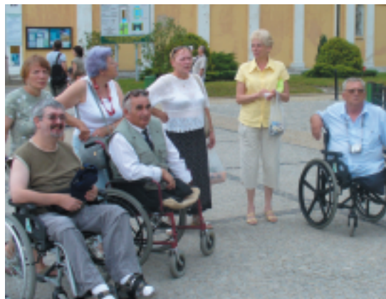
Zwiedzanie sanktuarium w Świętej Lipce dostarczyło wielu niezapomnianych wrażeń

Dla wielu z nas tego typu wyprawy są trudnodostępne, dzięki temu, że jesteśmy w grupie, łatwiej się zorganizować. Nam niepełnosprawnym nie jest łatwo podróżować, dlatego cieszę się, że wszystko tak świetnie się udało.