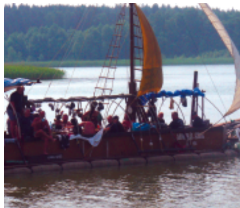
Na trasie Giżycko - Mikołajki - Ruciane mijaliśmy m.in. statki pirackie