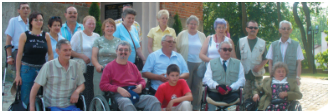
Gietrzwałd - sanktuarium określane jako Warmińska Częstochowa lub Polskie Lourdes