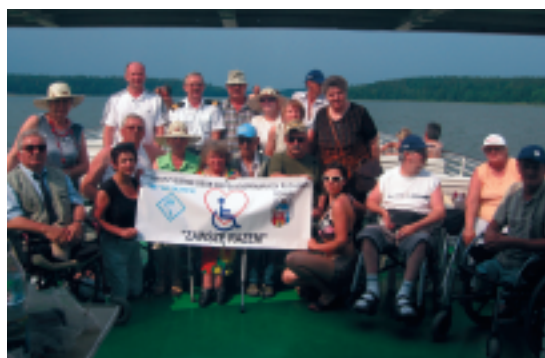
Wycieczka była naprawdę udanym wyjazdem