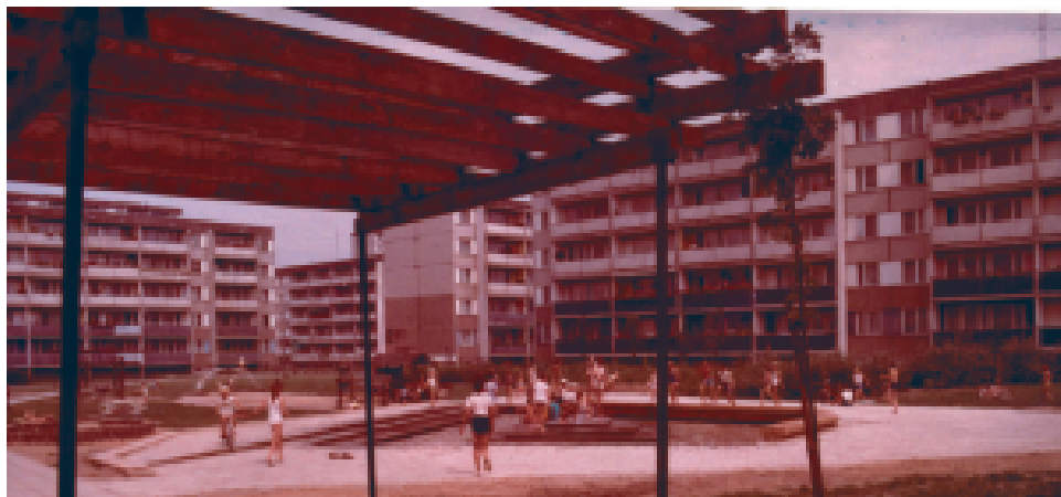
Ligi Polskiej. Teraz budynki są kolorowe i ocieplone, jest bujna zielen i całkiem nowa fontanna.

W MZD działa całodobowy numer pod którym można zgłaszać uszkodzenia dróg i sygnalizacji: 96 33 po 15.00. Do 15.00 działa numer: 56 661-78-08