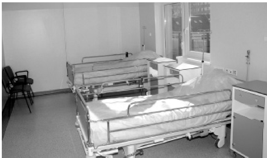
Sale są estetycznie wykończone i wyposażone

W Zakładzie są trzy oddziały opieki całodobowej. Wszystkie wyposażone w nowoczesny sprzęt pielęgnacyjny i rehabilitacyjny. Jest również stanowisko umożliwiające obserwację sal za pomocą monitoringu oraz kaplica. Dzięki rozbudowie placówka może zapewnić opiekę 100 osobom przez całą dobę i 30 w systemie dziennym. Zakład ma certyfikat ISO.