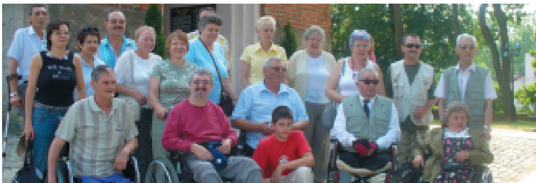
Gietrzwałd - sanktuarium określane jako Warmińska Częstochowa lub Polskie Lourdes