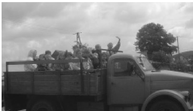
Wyprawa do gospodarstwa agroturystycznego to okazja do poznania uroków wsi