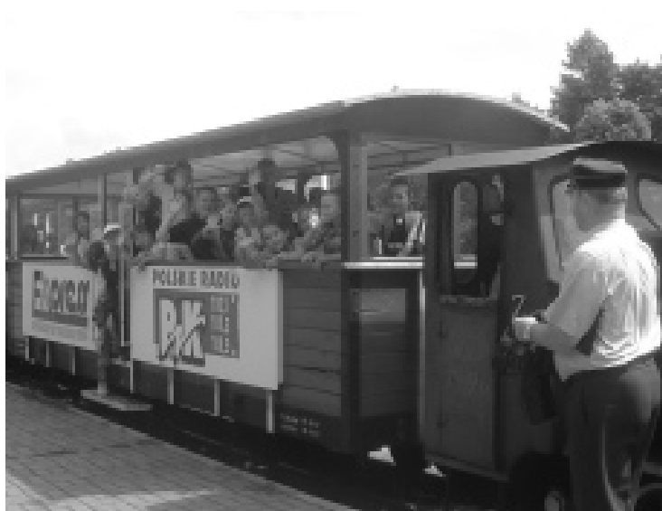
Przejazd koleją wąskotorową