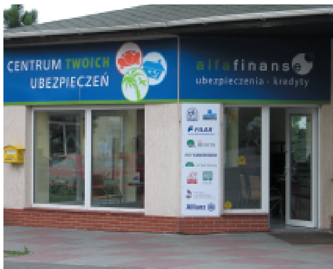
Do Alfa Finanse łatwo trafić. Siedziba jest na przeciwko biur spółdzielni „Na Skarpie”