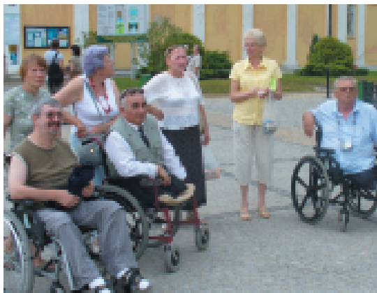
Zwiedzanie sanktuarium w Świętej Lipce dostarczyło wielu niezapomnianych wrażeń

Dla wielu z nas tego typu wyprawy są trudnodostępne, dzięki temu, że jesteśmy w grupie, łatwiej się zorganizować. Nam niepełnosprawnym nie jest łatwo podróżować, dlatego cieszę się, że wszystko tak świetnie się udało.