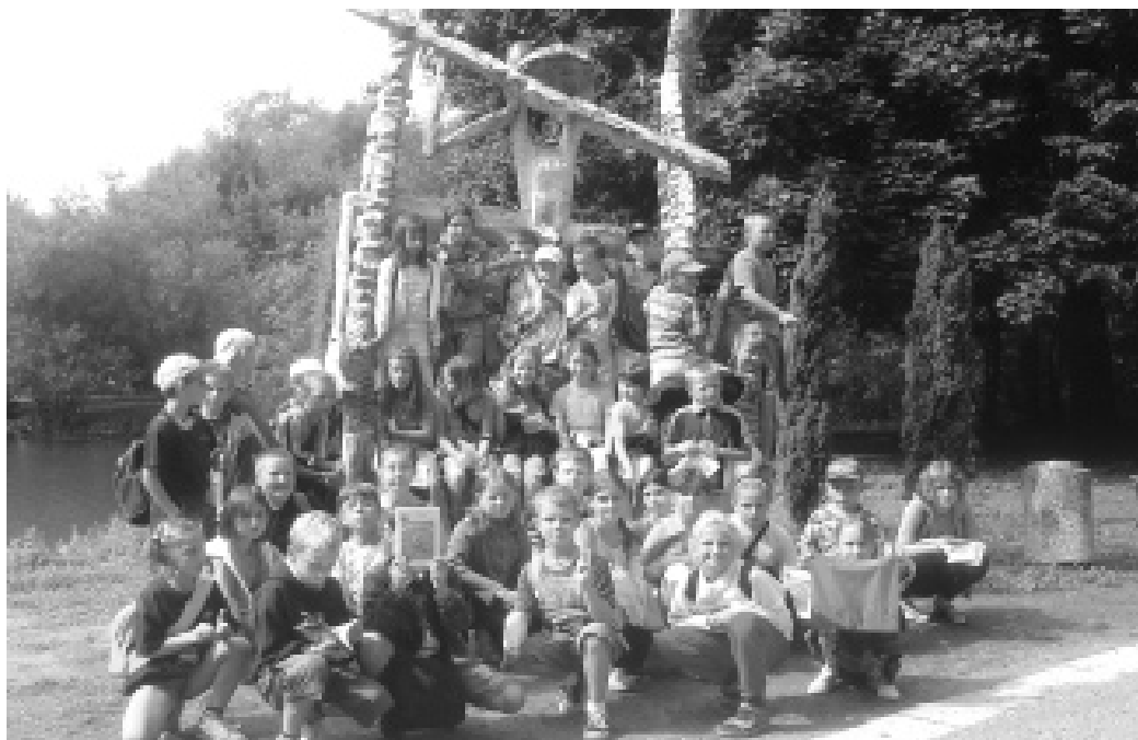
Wycieczka do Myśliczka była jedną z atrakcji półkolonii w zeszłym roku

kać się będą w Vademecum w każdy poniedziałek i środę w godzinach od 14 do 19