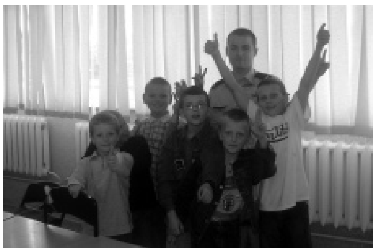
Spotkanie z policjantem było dla dzieci bardzo ciekawe