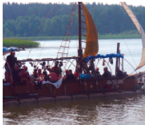
Na trasie Giżycko - Mikołajki - Ruciane mijaliśmy m.in statki pirackie