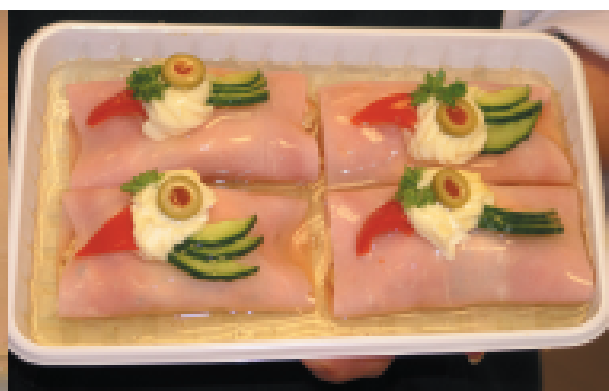
Tradycyjne jajko w szynce wybrane przez panią Justynę na stół imieninowy wygląda i smakuje znakomicie

kę śledziową z buraczkami, śledzia w śmietanie i oleju, oraz sałatkę z tuńczyka. Gdybym miała skomponować imieninowy zestaw, wybrałabym jajko w szynce (porcja - 2,99), śledzia w bu-