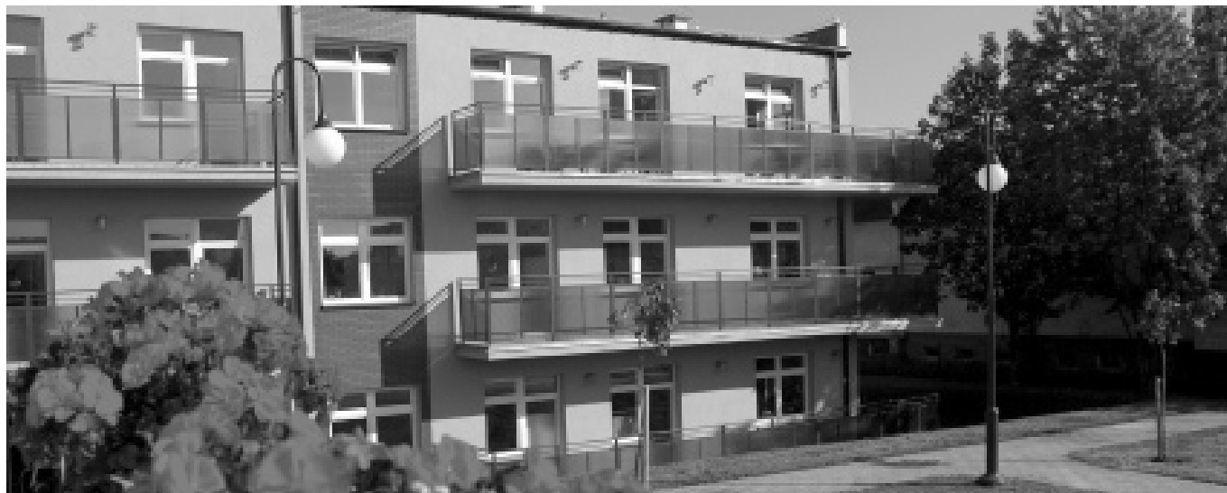
Budynek przy ul. Ligi Polskiej naprzeciwko dawnego Rywala jest Zakładem Pielęgnacyjno-Opiekuńczym