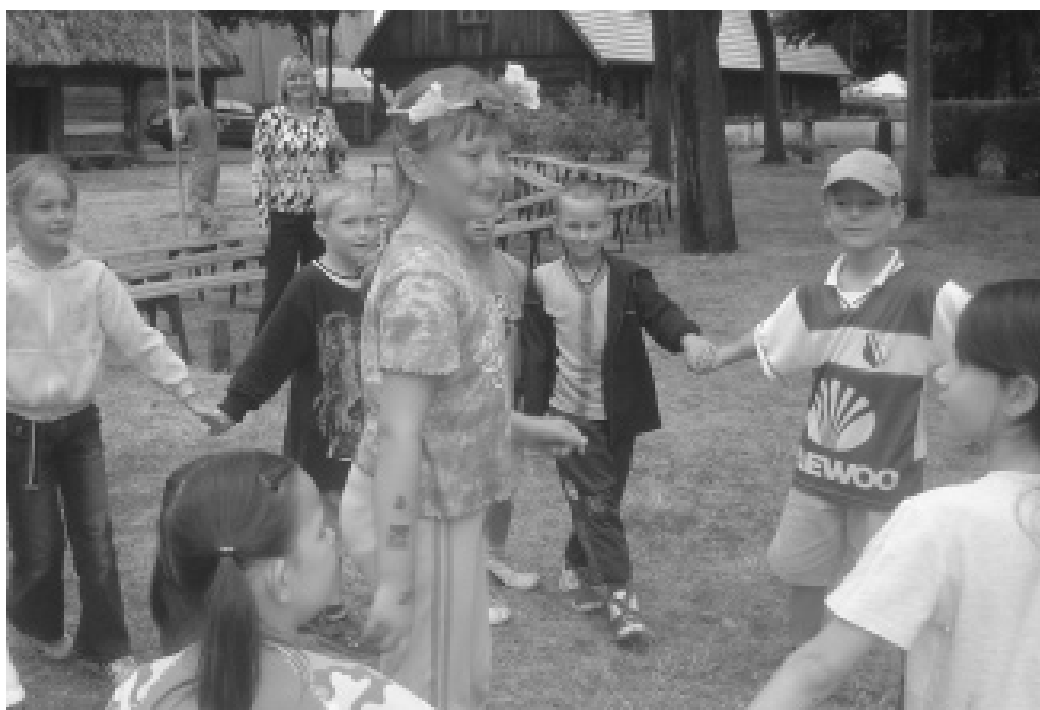
Dzieci świetnie bawiły się w Muzeum Etnograficznym

ćwiczeń kształtujących sylwetkę zapraszamy we wtorki i czwartki do Klubu Zodiak we wtorki i czwartki o 18 i 19.